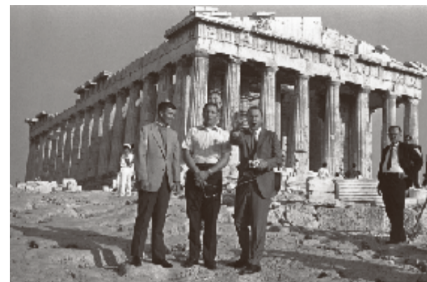
Vi har mycket att tacka de grekiska gudarna för. De tre astronauterna från den dramatiska Apollo 13-resan på besök i Apollons land - han som gett namn åt deras rymdprogram.